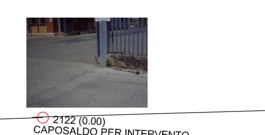
2122 (R. 50) CORSO PER INTERVENTO PUNTO DI VERIFICA (CANCELLI SCORREVOLI)