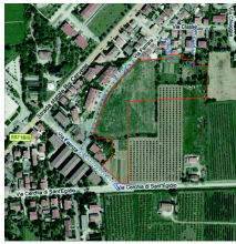
ELABORAZIONE: STUDIO ARCHITETTO PIANO PUNTI DI RIPRESA FOTOGRAFICA

Scale: 1:1000 (Piani d'Area), 1:500 (Pianta)