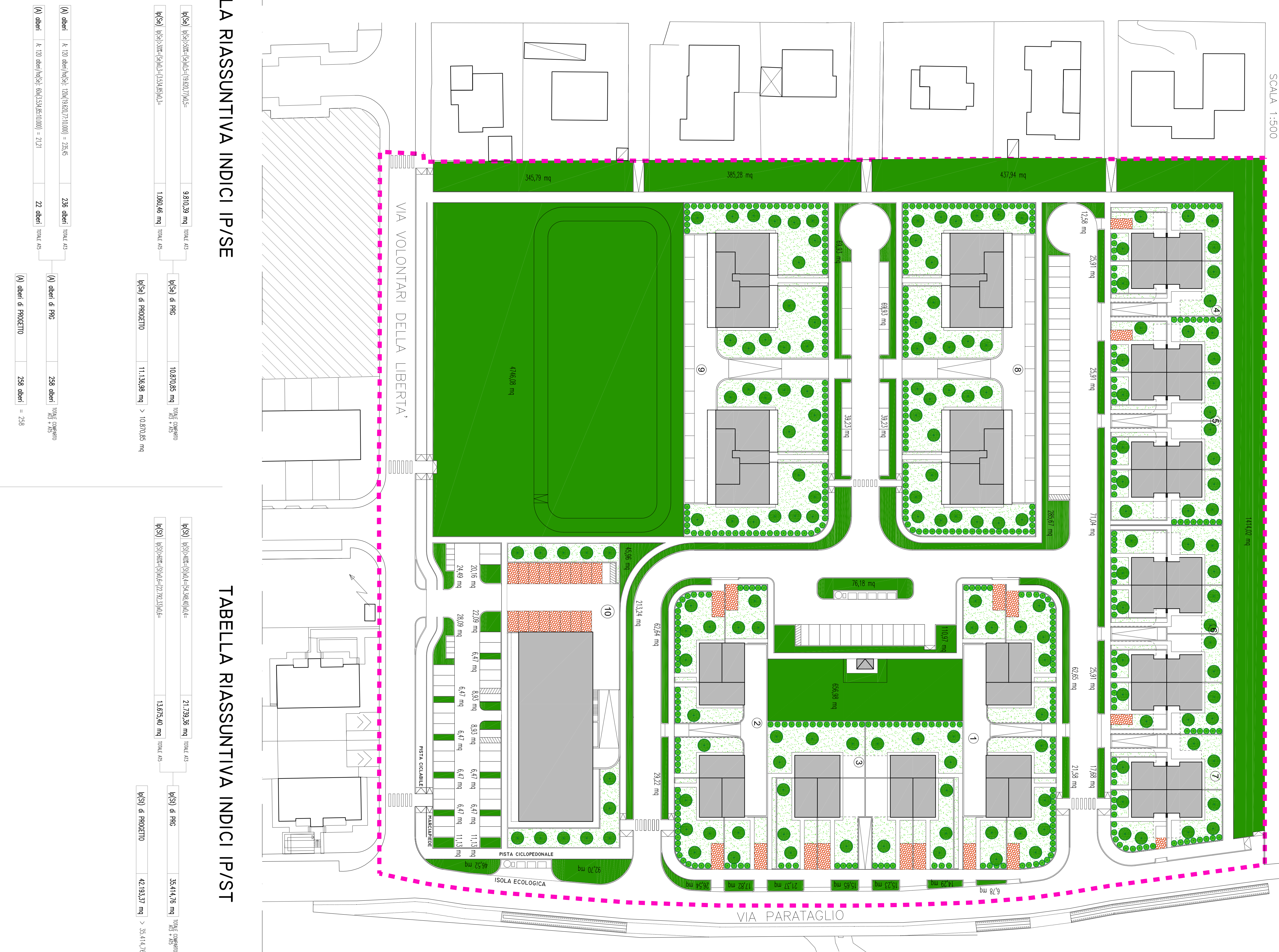
TABELLA RIASSUNTIVA INDICI IP/SE