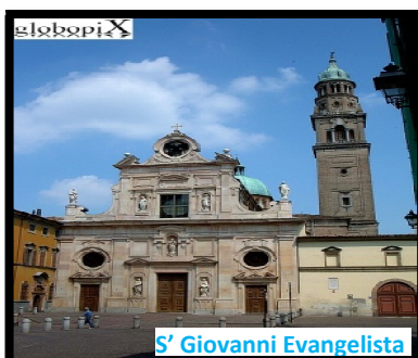
S' Giovanni Evangelista