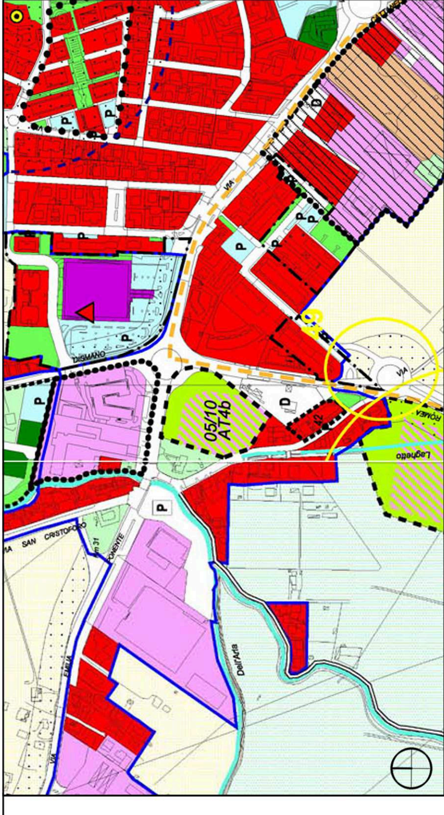
ESTRATTO DI PRG - Scala 1:5000