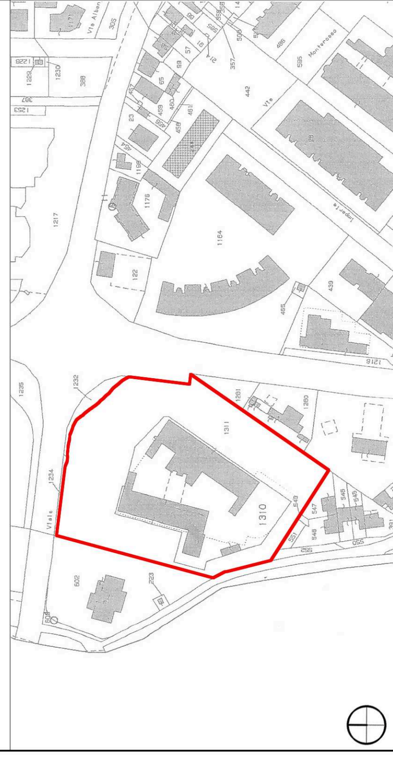
ESTRATTO DI MAPPA CATASTALE - Scala 1:2000