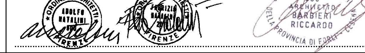
TAVOLA N° 29b