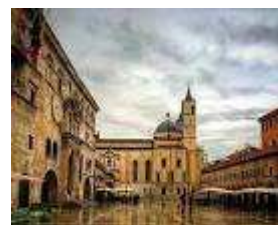
Palazzo del Popolo

Partenza: in pullman alle ore 5,30 dal Piazzale E. Berlinguer "Frutipapalina".