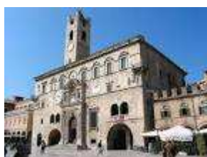
Palazzo dei Capitani