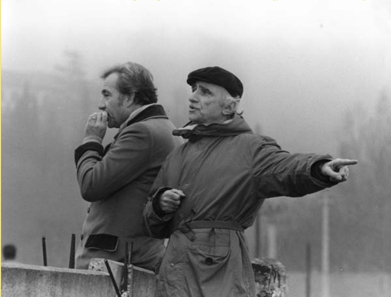
Amici miei, Ugo Tognazzi e Mario Monicelli