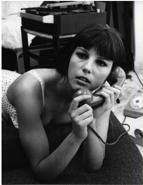
Io la conoscevo bene, Stefania Sandrelli

La Sandrelli ha appena 16 anni quando debutta al fianco di Mastroianni in Divorzio all'italiana , capolavoro della commedia italiana di Pietro Germi del 1961. Dopo questo successo l'attrice sarà diretta dai più importanti registi: Bertolucci, Comencini, Monicelli, Scola. Un racconto in prima persona dei magici incontri cinematografici di Stefania Sandrelli.