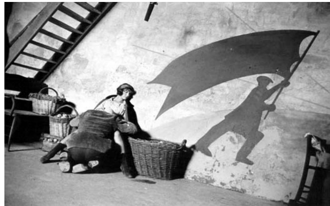
Novecento, Stefania Sandrelli

Dalle riprese dei film di Fellini, Scorsese, Terry Gilliam, Tim Burton, Julie Taymor alle immagini di repertorio, alcune inedite (fotografie, documentari, making of), interviste e backstage che ricostruiscono non solo la carriera ma la storia più personale e privata di un artista che con semplicità ha trasformato la passione per la scenografia nelle più geniali realizzazioni cinematografiche del mondo.