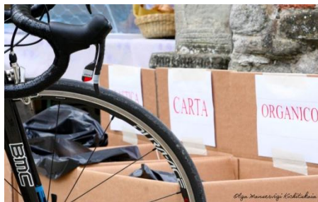
RavoRando 2012 ASD GS Ravonese Bologna