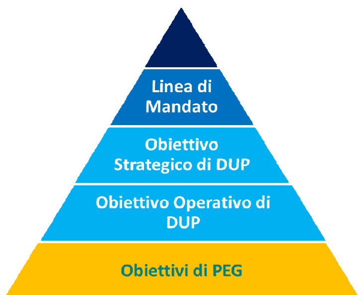
Il Modello di albero della performance del Comune di Cesena

La misurazione della performance, sia essa individuale, organizzativa o di ente, avviene attraverso la valorizzazione del sistema di indicatori sottostante all'albero della performance.