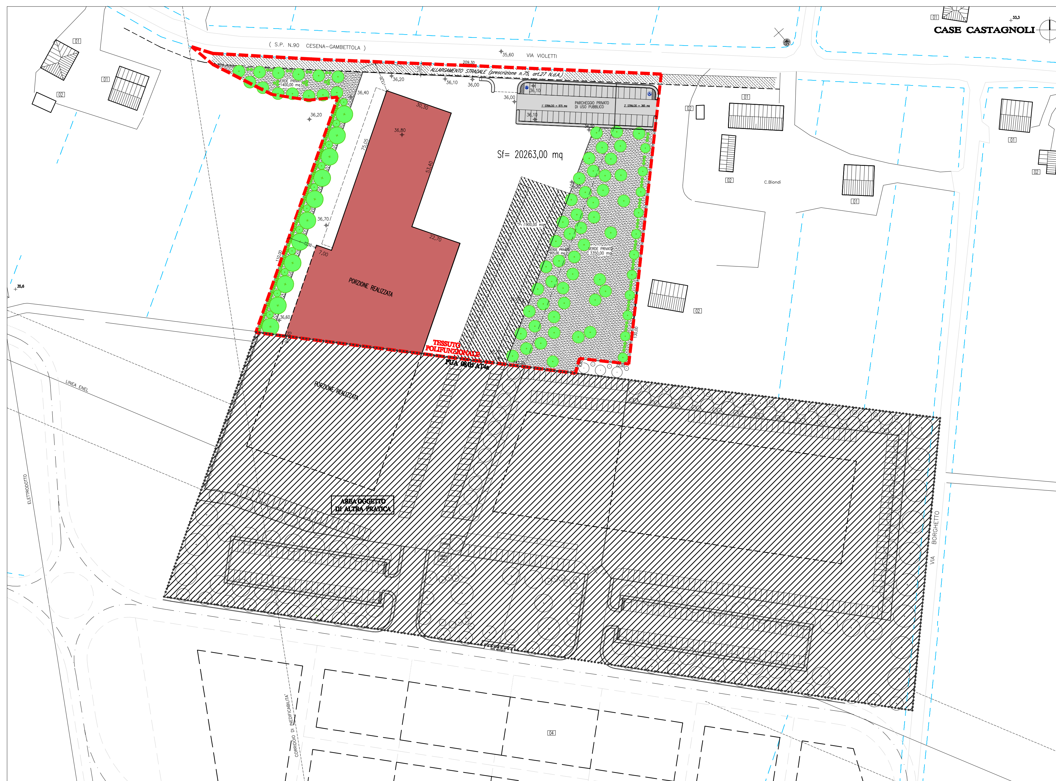
PLANIMETRIA STATO APPROVATO 1:1000 (AUTORIZZAZIONE UNICA n° 18 del 16/04/2009, n° 45 del 29-07-2009 e n° 2 del 11-02-2010)