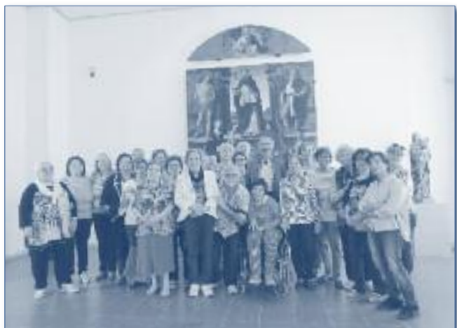
Rimini, Museo della Città, 23 maggio 2017

Dal 2015 è possibile indicare l'U.T.E. come beneficiaria del 5% riportando il C.F. 90011420404.