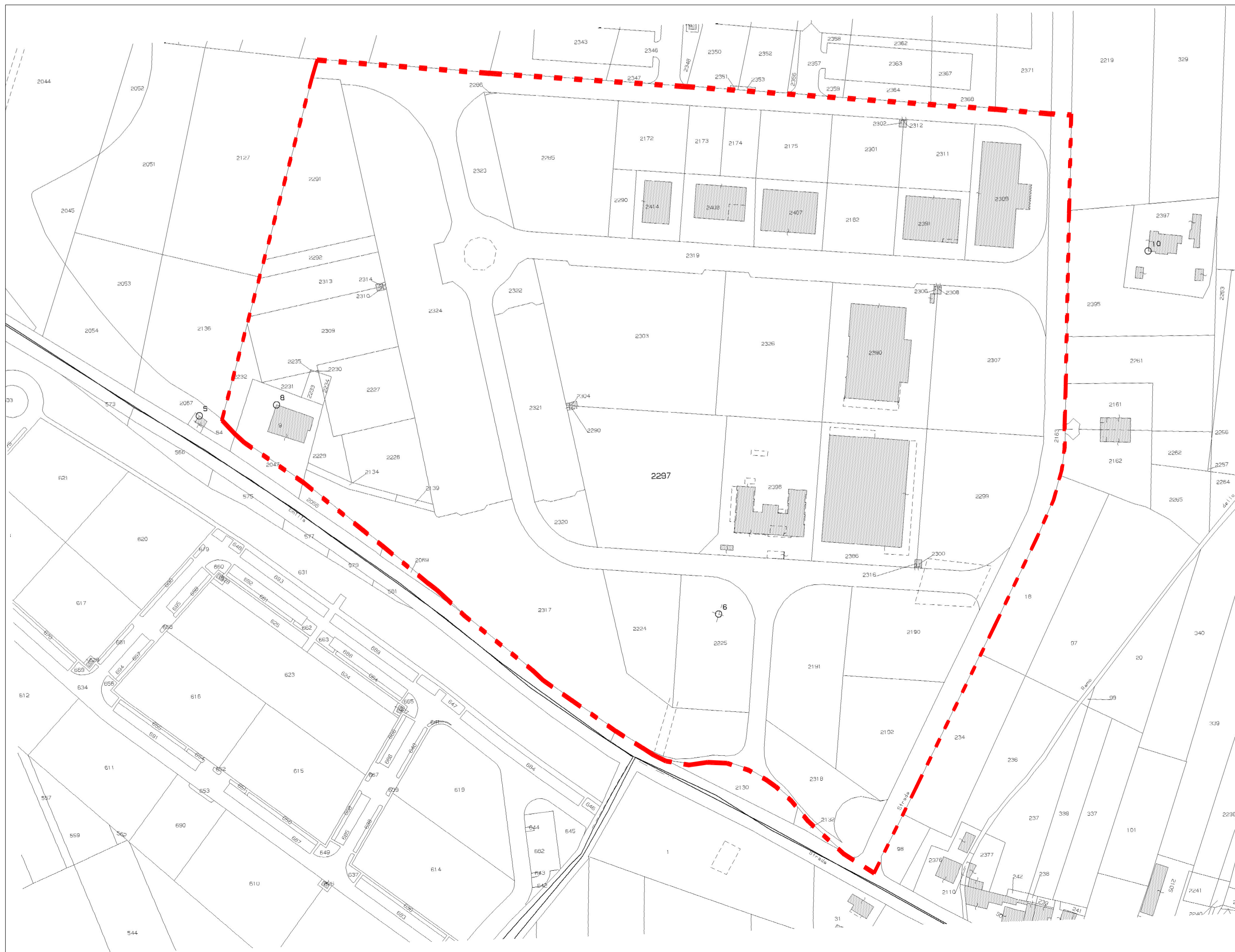
STRALCIO PLANIMETRIA CATASTALE 1:2000