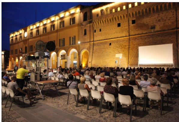
Piazza del Popolo

La pluripremiata attrice fiorentina (2 David di Donatello, 1 Nastro d'argento, oltre alla Coppa Volpi alla Mostra di Venezia nel 2014), sarà a Cesena mercoledì 20 luglio per raccontare i momenti significativi della sua carriera e per presentare il film Hungry Hearts , che Piazze di Cinema propone insieme ad altre 3 pellicole in cui Rohrwacher è protagonista: Sorelle Mai di Marco Bellocchio (13 luglio, Chiostro di San Francesco) L'Uomo che Verrà di Giorgio Diritti (15 luglio, Chiostro di San Francesco) e Le Meraviglie di Alice Rohrwacher (16 luglio, Chiostro di San Francesco).