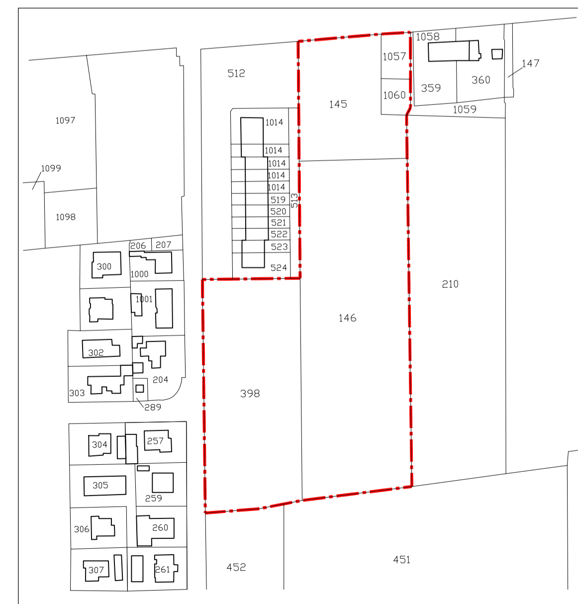
PLANIMETRIA CATASTALE scala 1:2000