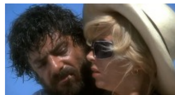
Travolti da un insolito destino

"Villeggiatura e vacanze nel cinema italiano 1949 - 2011" , una raccolta di fotografie di scena (alcune inedite) che vuol rendere conto di come il cinema italiano abbia raccontato le vacanze, da occasione destinata a pochi privilegiati a momento di spensieratezza di massa - negli anni del Boom - fino ai primi evidenti segnali della crisi. La vacanza come specchio del paese , raccontata da un cinema che privilegia la commedia ma non solo. Curata da Antonio Maraldi e realizzata da Pixelplanet, la mostra è stata prodotta nel 2012 dal Comune di Rosignano Marittimo, in collaborazione col Centro Cinema Città di Cesena. Parte della mostra sarà ospitata anche nella galleria del Centro commerciale Lungo Savio.