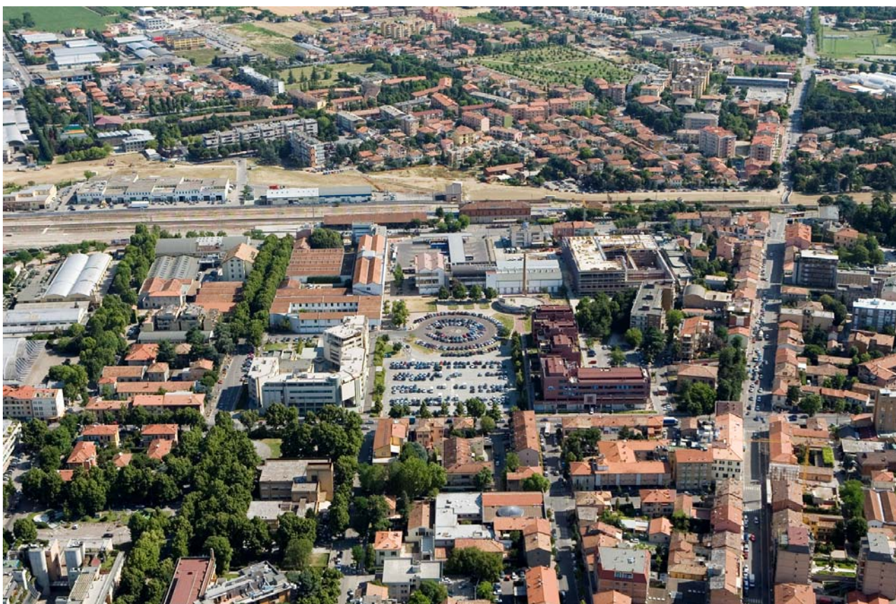
4 Foto dall'elicottero da sud verso il quartiere "Vigne"