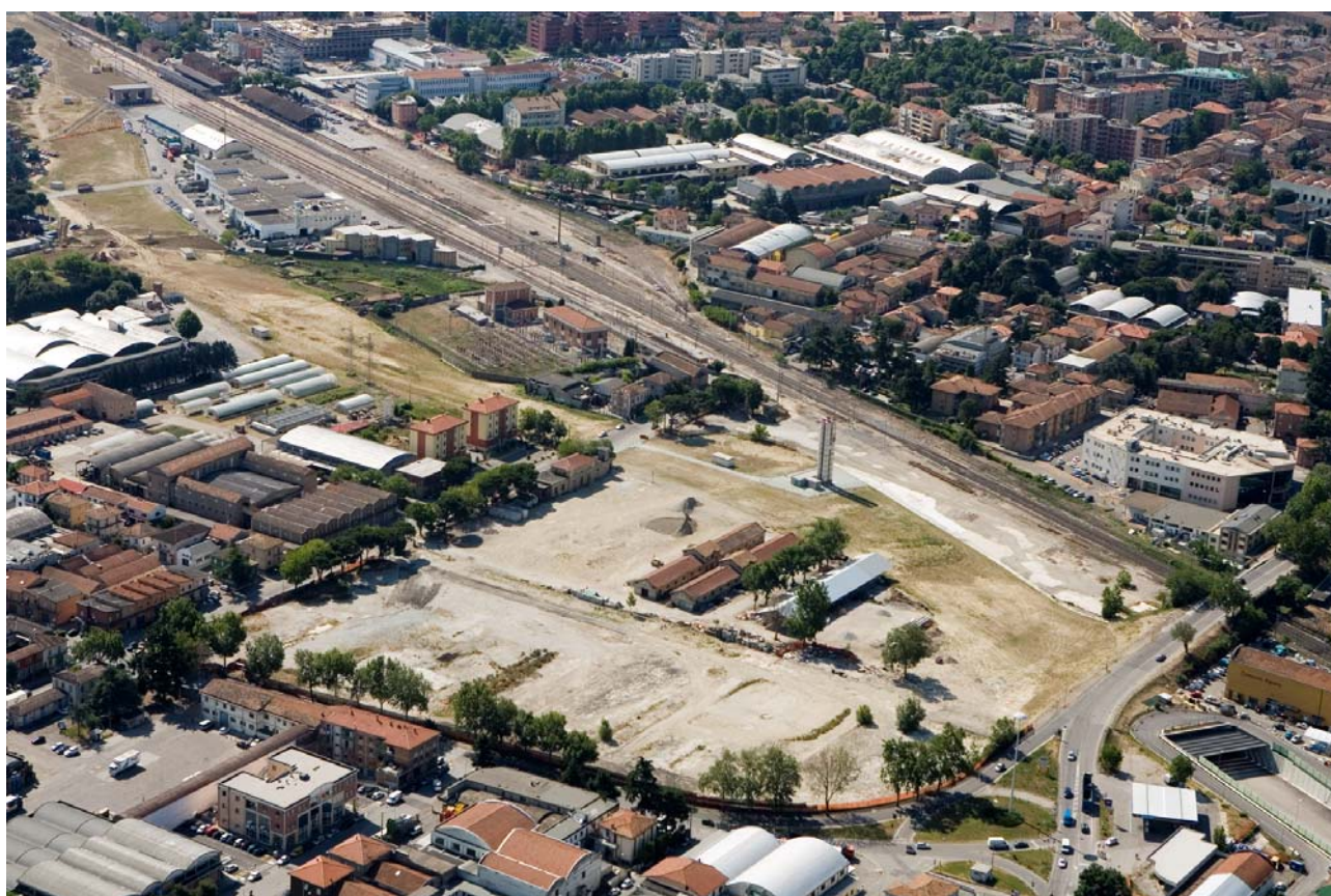
6 Foto dall'elicottero da nord-ovest dell'ex-mercato ortofrutticolo