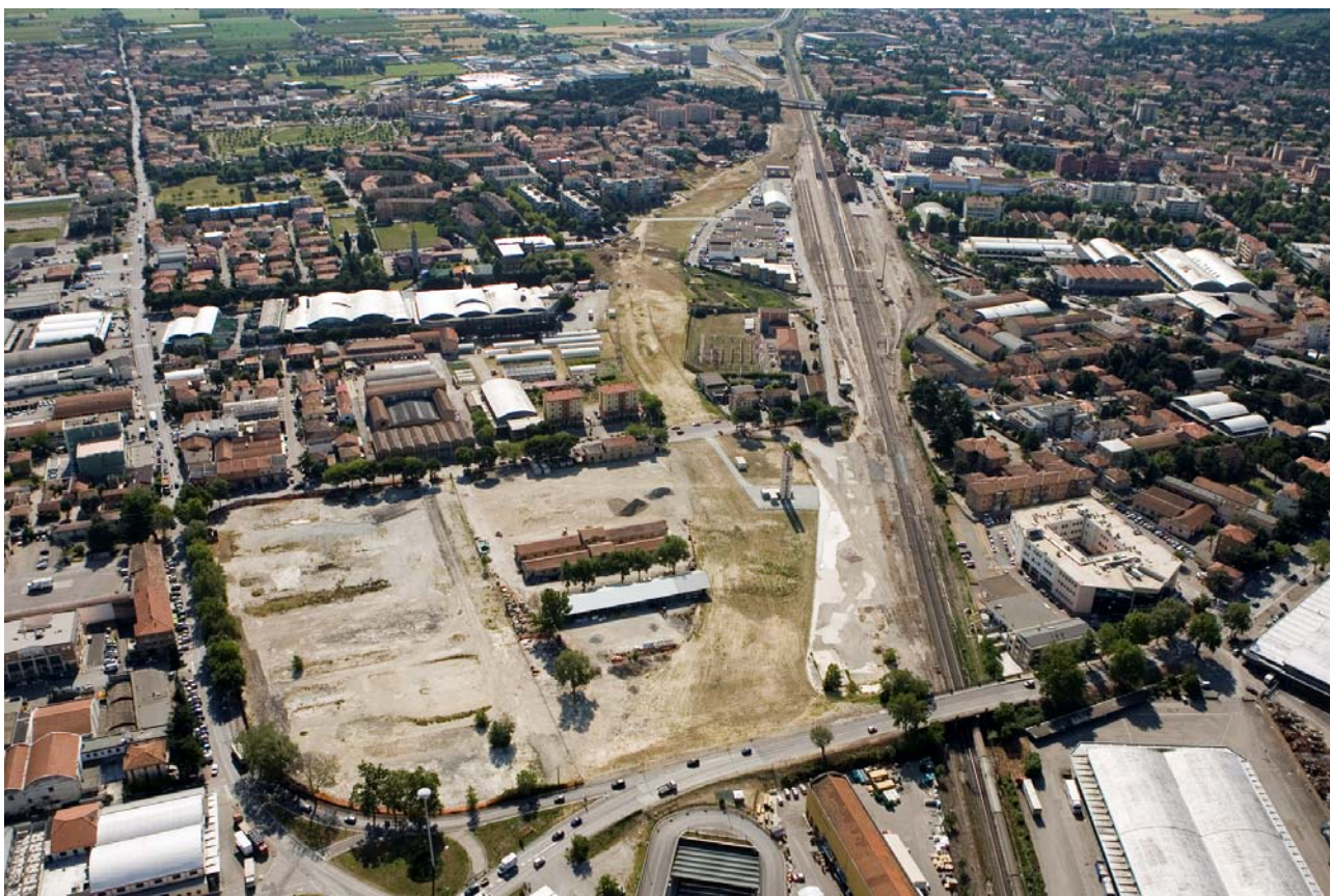
1 Foto dall'elicottero da ovest