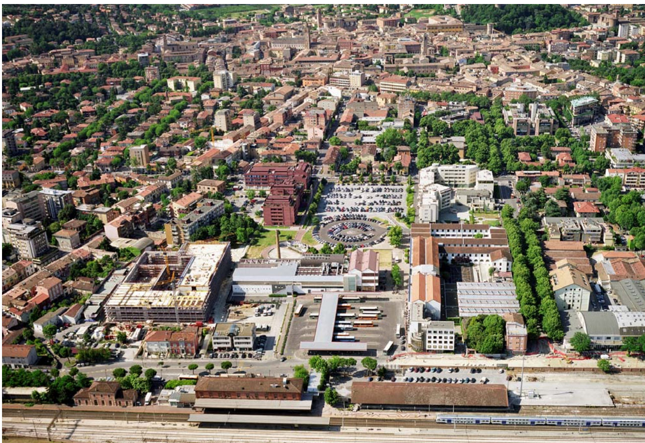
3 Foto dall'elicottero da nord verso il centro storico