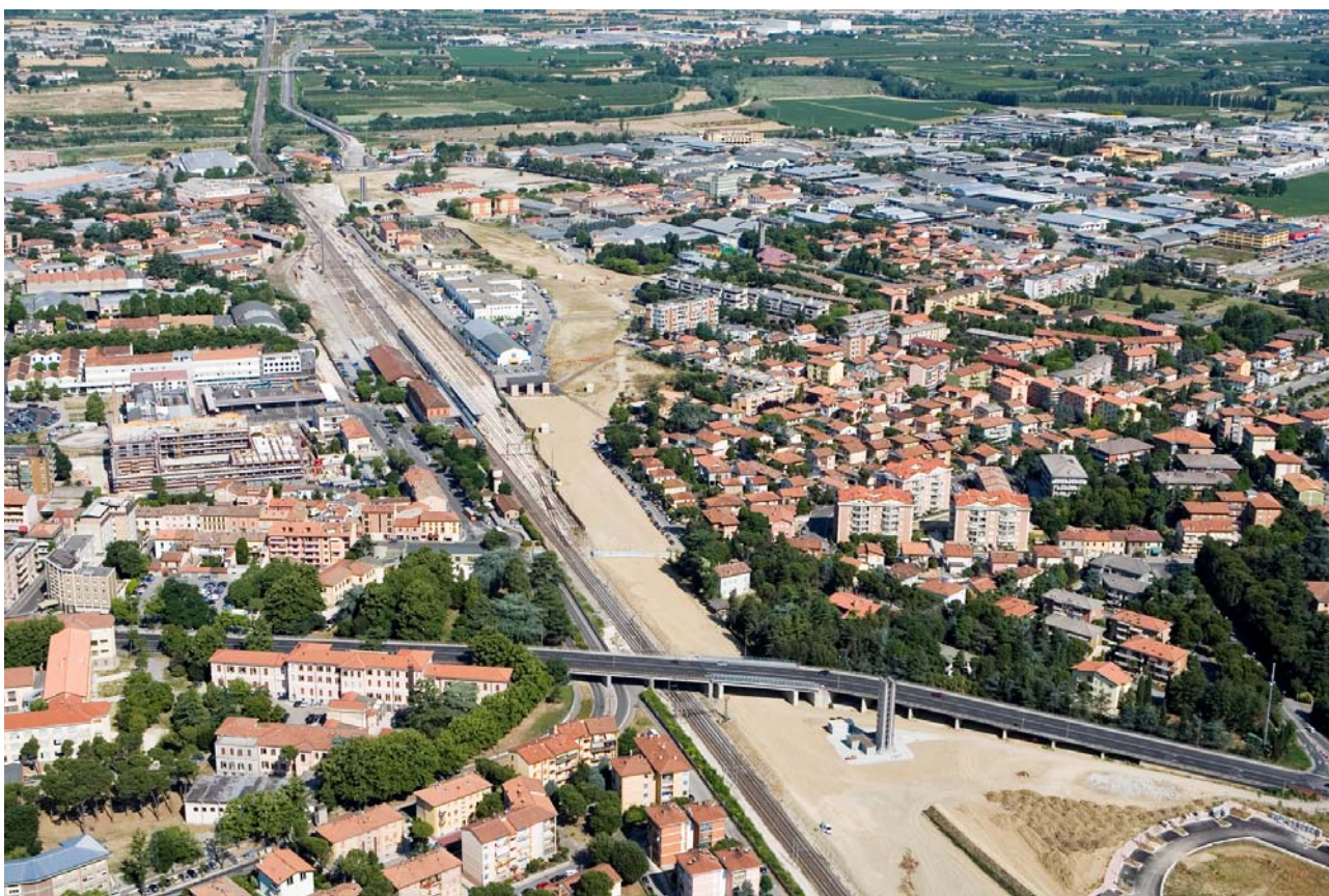
2 Foto dall'elicottero da est