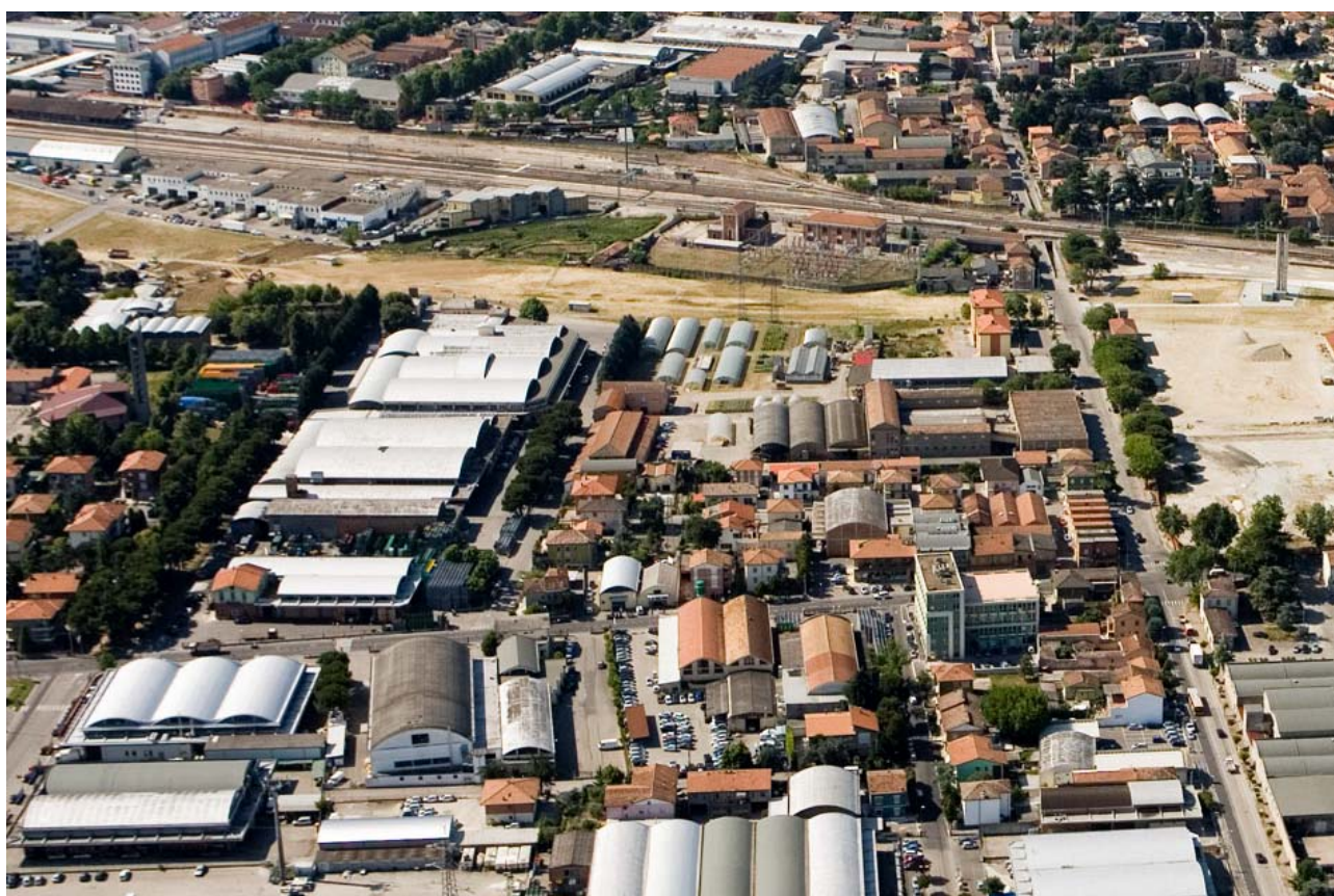
8 Foto dall'elicottero da nord delle aree private (SAIS, VICO, CILS)