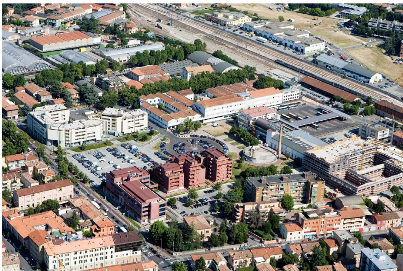
10 Foto dall'elicottero da sud-est dell'area ex-Arrigoni