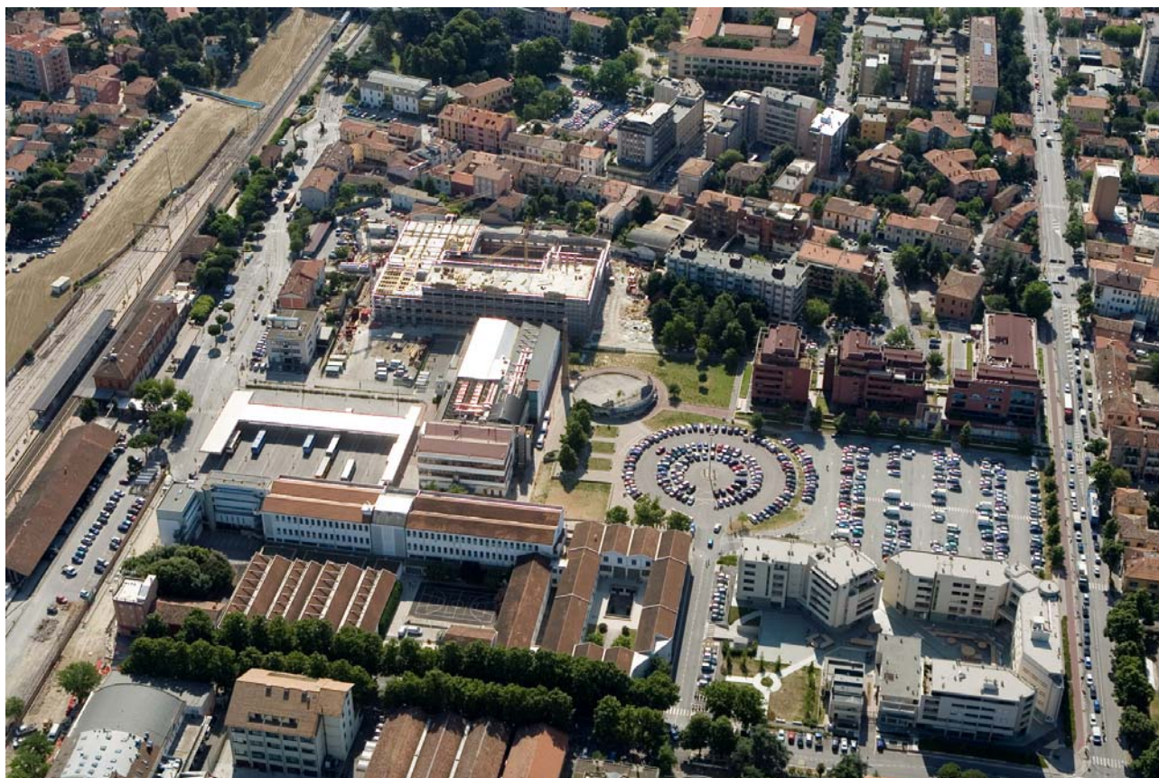
9 Foto dall'elicottero da ovest dell'area ex-Arrigoni