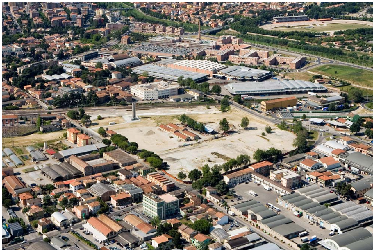
5 Foto dall'elicottero da nord dell'ex-mercato ortofrutticolo