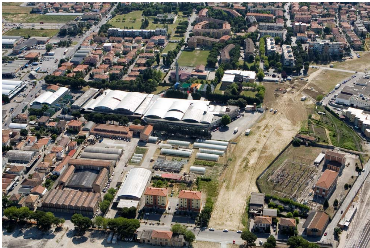
7 Foto dall'elicottero da ovest delle aree private (SAIS, VICO, CILS)