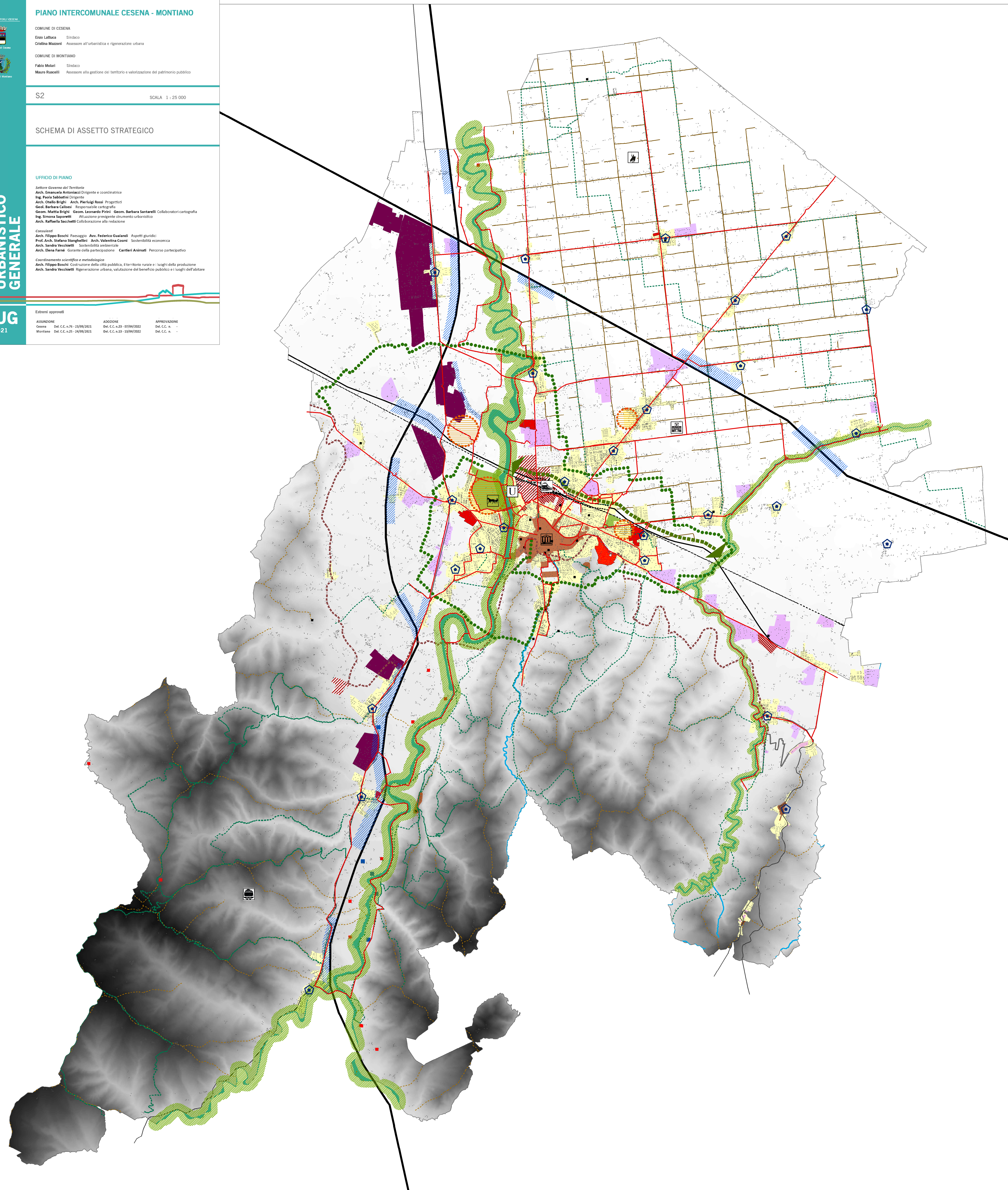
Schema di assetto strategico