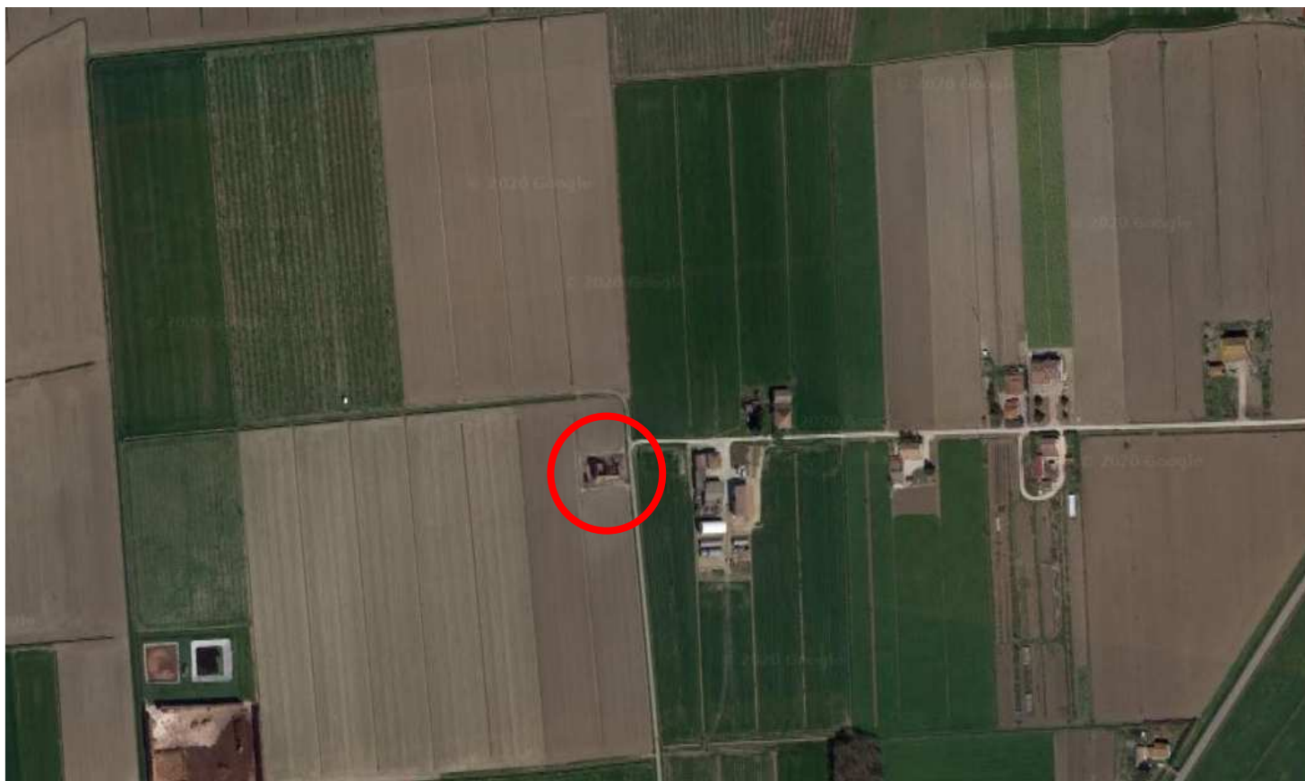
Immagine non in scala