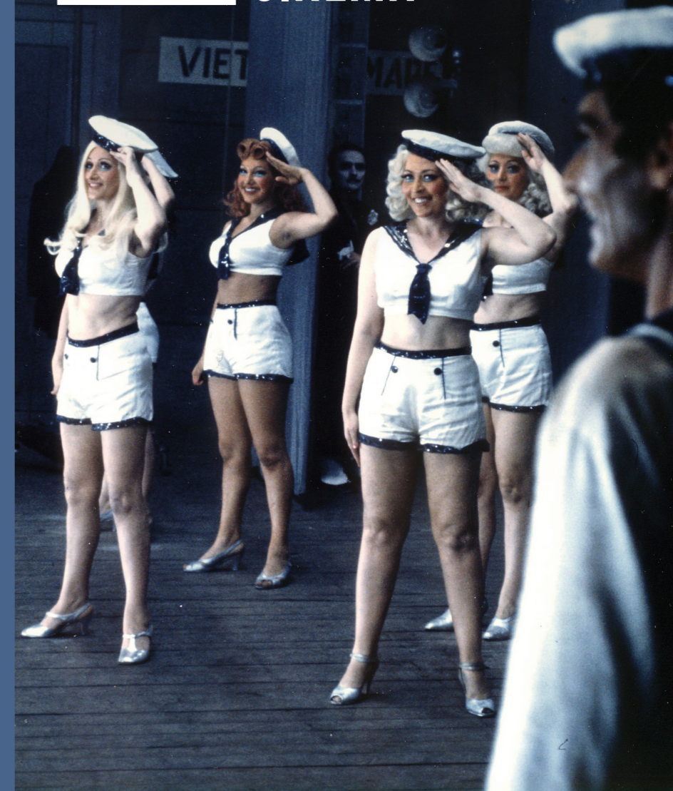
Roma di Federico Fellini (1972)