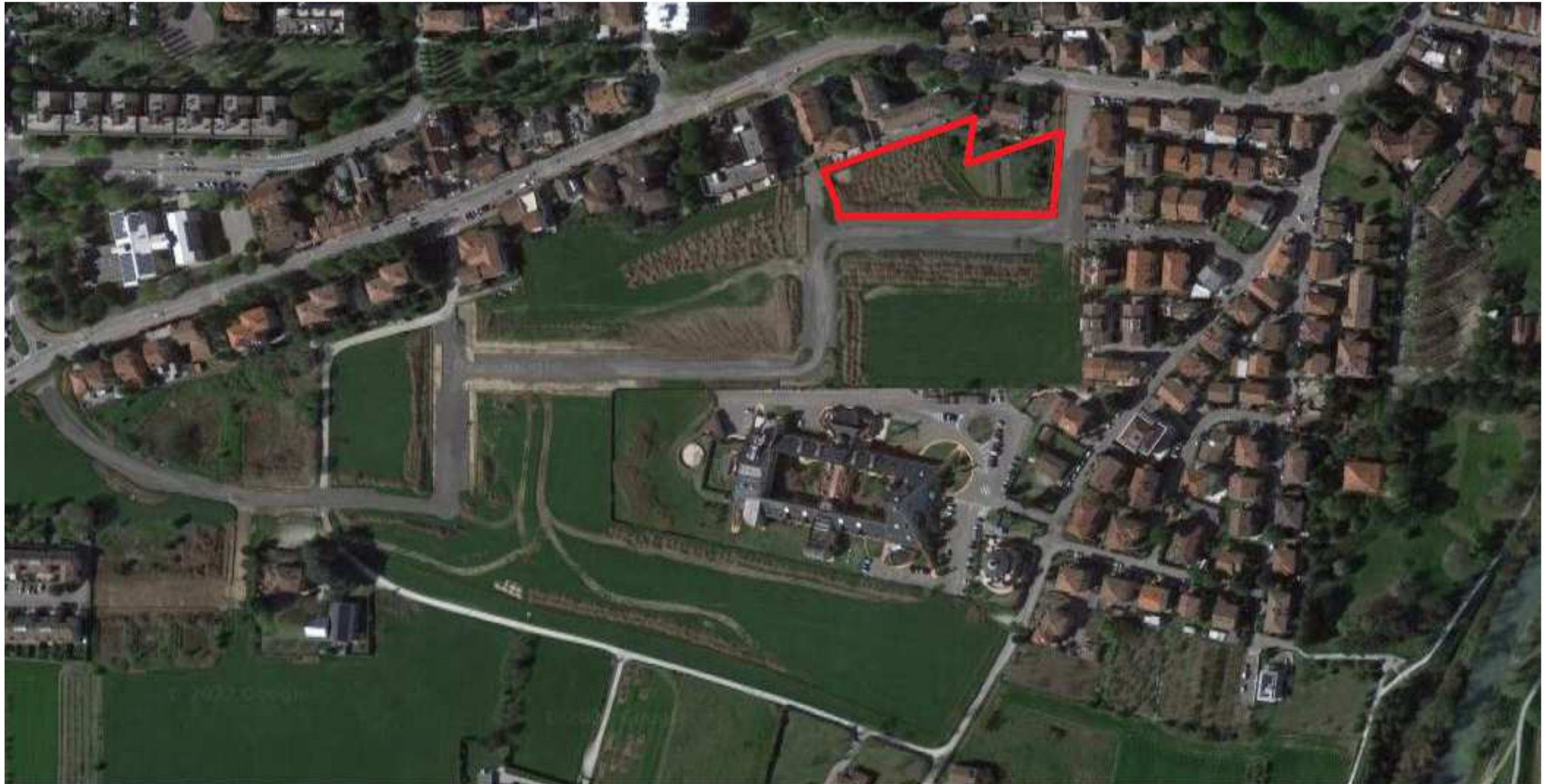
Rappresentazione non in scala