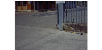
CANALINO PER INTERVENTO PUNTO 2122 (CANTIERE SCORREVOLE)