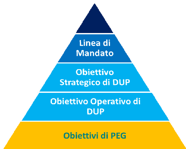
Il Modello di albero della performance del Comune di Cesena

Per ottenere il calcolo della percentuale finale dell'ambito Programmi e Progetti è necessario prendere in considerazione l'albero della performance .